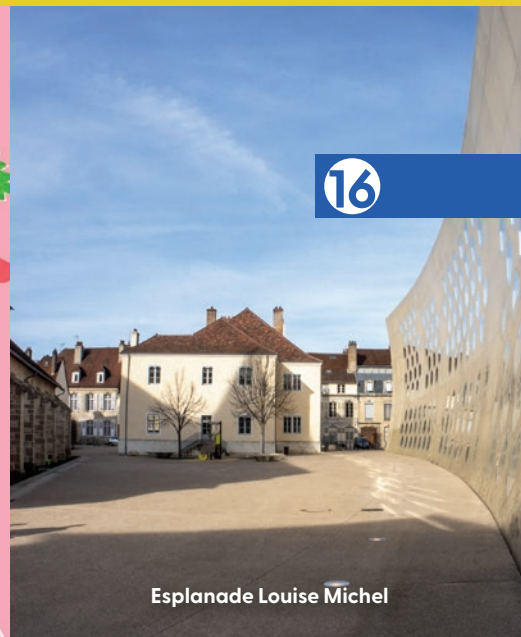
Esplanade Louise Michel